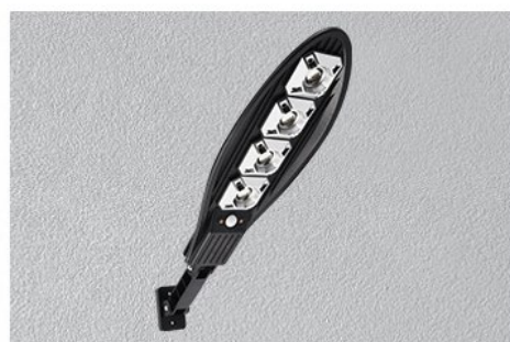
Step 4: Align the product mounting bracket with the hole position and tighten the screws