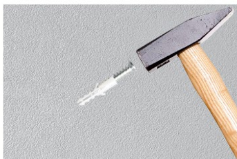
Step 2: Use a hammer to drive the expansion screw into the hole position