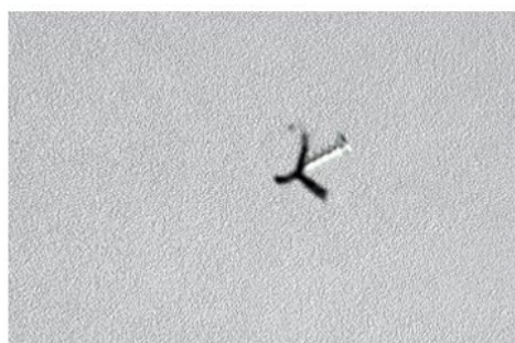
Step 3: Screw out the screws